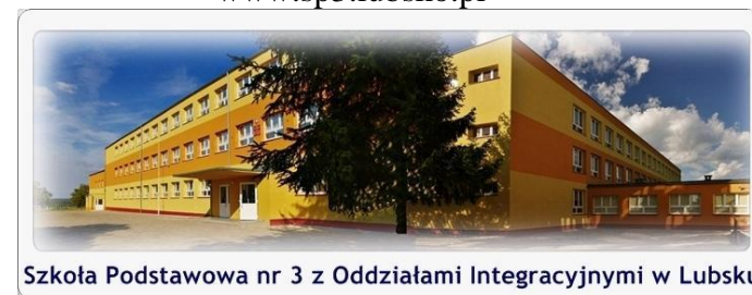
Szkoła Podstawowa nr 3 z Oddziałami Integracyjnymi w Lubsku

Szkoła Podstawowa nr 3 z Oddziałami Integracyjnymi im. Adama Mickiewicza in Lubsko www.sp3.lubsko.pl