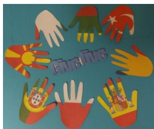
Nasza propozycja loga projektu

Wszystkie działania projektowe są dokumentowane i rozpowszechniane za pomocą strony internetowej szkoły, portali społecznościowych, strony internetowej projektu, na portalu eTwinning, i blogu prowadzonym po polsku.