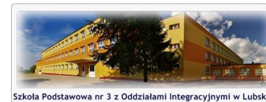
Szkoła Podstawowa nr 3 z Oddziałami Integracyjnymi w Lubsku

Szkoła Podstawowa nr 3 z Oddziałami Integracyjnymi im. Adama Mickiewicza w Lubsku www.sp3.lubsko.pl